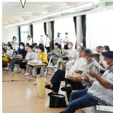
全体ディスカッション

四條畷市では、南小学校前のくすの木園跡地に新たな都市公園の整備を予定しています。住民の皆さまに親しまれる公園となるよう、計画段階から皆さまと一緒に公園について考えるワークショップを開催しています。全3回のワークショップの様子はこのワークショップニュースを通じて市民の皆さまに発信していきます。2ページで主な意見を紹介しています。 ※公園整備事業の概要については3ページをご確認ください。