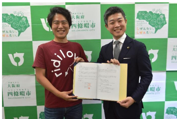
安部代表取締役と東市長