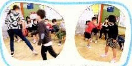
バトンの受け渡し練習中！

サクラタイムが終わり、外の遊び、そして自分たちで集まり、リレー自主練が始まりました！