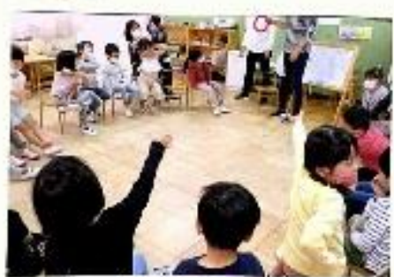
では、こうやってもらうね！