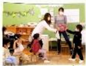
これをだいてまかく！

とまらなくていい！ ひつかりをだいてまかく！ もらうときのたまごをよぶ！ これをだいてまかく！