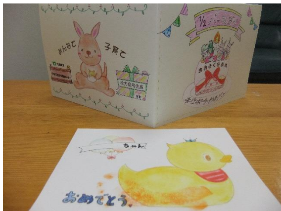
1/2 バースデイカードの見本